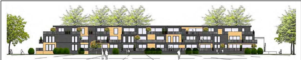
Abb. Ansicht gemäß Entwurfsplanung

Die bestehenden freistehende Wohngebäude weisen eine maximale Höhe von nur ca. 6-6,5m auf (1,5-2-geschossige Bebauung). Die geplante Bebauung mit den 2 Vollgeschossen plus Staffelgeschoss auf einer erhöhten Souterrain-Tiefgaragen wird eine Höhe von 11,00 m erreichen und damit die umliegenden Gebäude deutlich überragen. Dadurch, dass es sich hierbei nicht um einzelne freistehende Einfamilienhäuser handelt, sondern um eine geschlossene 3-geschossige Bebauung über 79,5 m wird massiv in das Landschaftsbild eingegriffen.