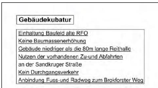
Abb. Auszug aus der Entwurfsplanung

In der direkt angrenzenden Umgebung ist für das allgemeines Wohngebiet GRZ 0,2 und GFZ 0,2 festgesetzt. Bei der Grundstücksgröße von 13.124 m 2 entspricht das max. 2.625 m 2 , d.h. max. 20% der Grundstücksfläche darf überbaut (versiegelt) werden. Diese Maß wird mit der geplanten Bebauung wesentlich überschritten. Die geplante Bebauung, mit einer geplanten Wohnfläche von 5.650m 2 (überschlägige Bruttogrundfläche BGF ca. 7.060m 2 ) mit ca. Geschossflächenzahl GFZ 0,54 führt zu einer massiven Erhöhung der Baumassendichte auf dem Grundstück.